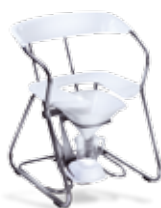
• Křeslo pro vyšetření žen a dětí