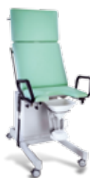
• Křeslo pro vyšetření žen a dětí